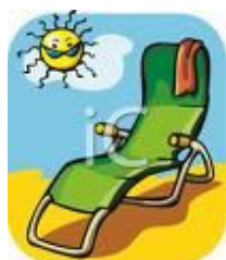
3. Hace sol